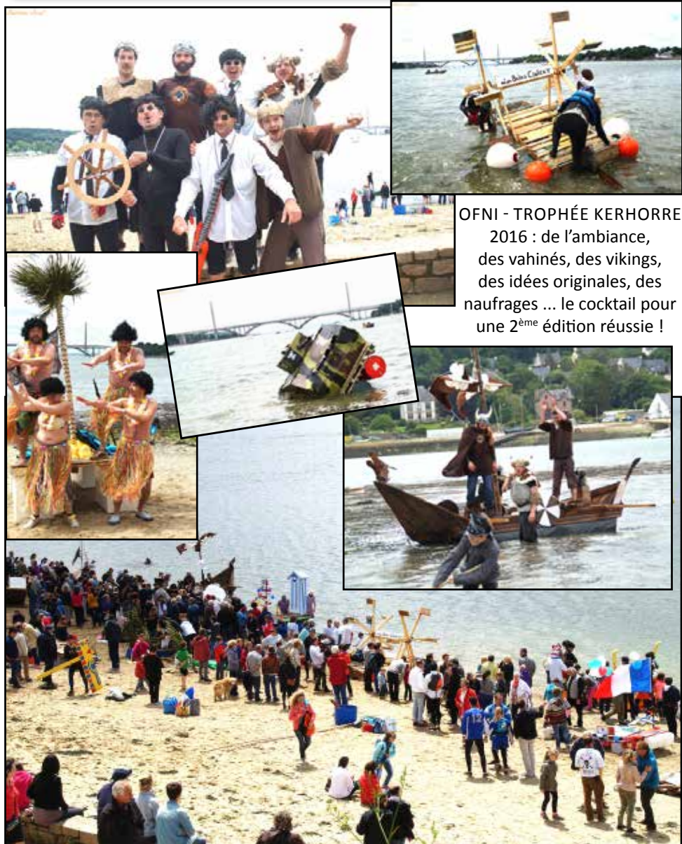
OFNI - TROPHÉE KERHORRE 2016 : de l'ambiance, des vahinés, des vikings, des idées originales, des naufrages ... le cocktail pour une 2 ème édition réussie !