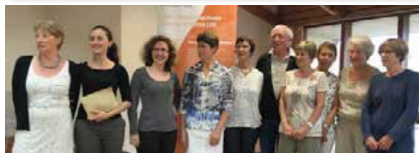
Le repas trimestriel des veuves UNC et OM

FIN D'ANNÉE BIEN OCCUPÉE DANS LES ASSOCIATIONS