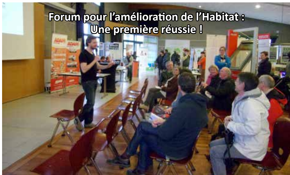
Forum pour l'amélioration de l'Habitat : Une première réussie !

Pour nous envoyer vos photos : en format jpeg ou tiff à l'adresse info@mairie-relecq-kerhuon.fr avant le lundi 12h.