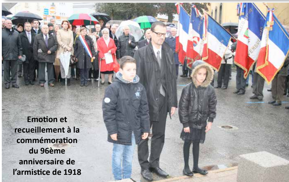
Emotion et recueillement à la commémoration du 96ème anniversaire de l'armistice de 1918