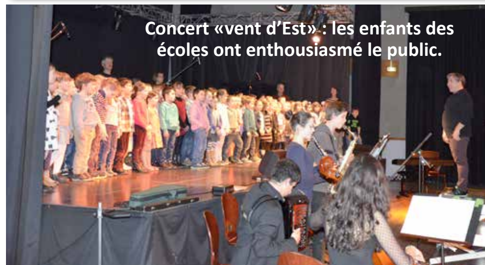
Concert «vent d'Est» : les enfants des écoles ont enthousiasmé le public.

Pour nous envoyer vos photos : en format jpeg ou tiff à l'adresse info@mairie-relecq-kerhuon.fr avant le lundi 12h.